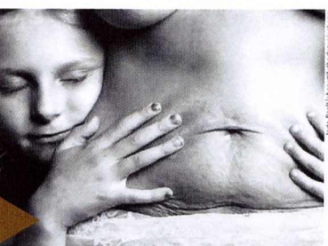
Amiga de fotógrafa, retratada no pós-gravidez com sua filha