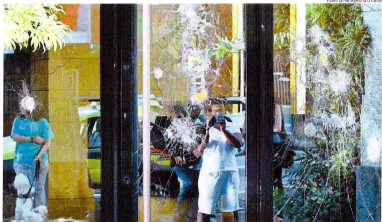
Vitrine quebrada na avenida Ataulfo de Paiva, no Leblon, zona sul do Rio, após protesto na madrugada de ontem