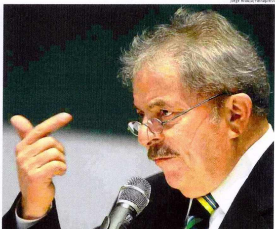
O ex-presidente Lula em palestra na Universidade do ABC, em São Bernardo do Campo (SP)

Fotógrafa quer ajudar mulheres a aceitar marcas do pós-parto C11